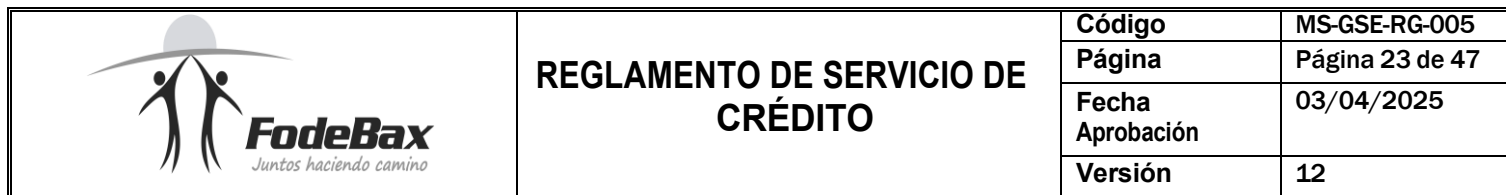
Tabla No. 1.